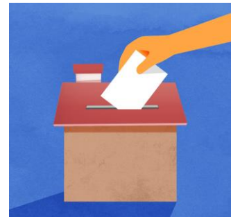
Slika glasačke kutije u koju se ubacuje glasački listić

Na osnovu Odluke o proceni pristupačnosti koju je donela Republička izborna komisija i kojom je uredila način i postupak procene pristupačnosti biračkih mesta i uz pomoć Uputstva o proceni koje je bilo sastavni deo Odluke, procena je obavljena od strane svih opštinskih i gradskih uprava.