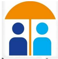
Logo Poverenice za zaštitu ravnopravnosti RS

Pod diskriminacijom osoba sa invaliditetom se, u skladu sa zakonom, označava svako pravljenje razlike ili nejednako postupanje, odnosno propuštanje (isključivanje, ograničavanje ili davanje prvenstva) u odnosu na lica ili grupe, kao i na članove njihovih porodica, ili njima bliska lica, na otvoren ili prikriven način, a koje se zasniva na invalidnosti ili razlozima u vezi sa njom.