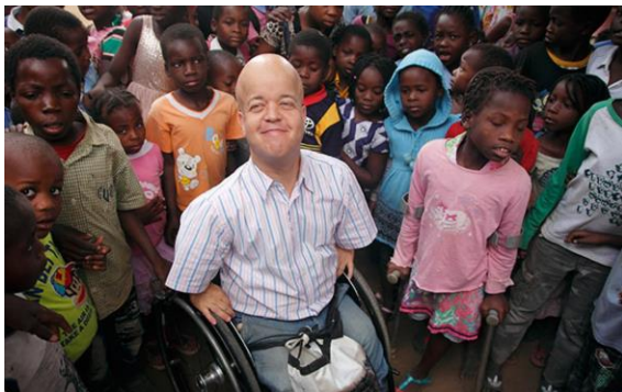
Fotografija Toma Šekspira